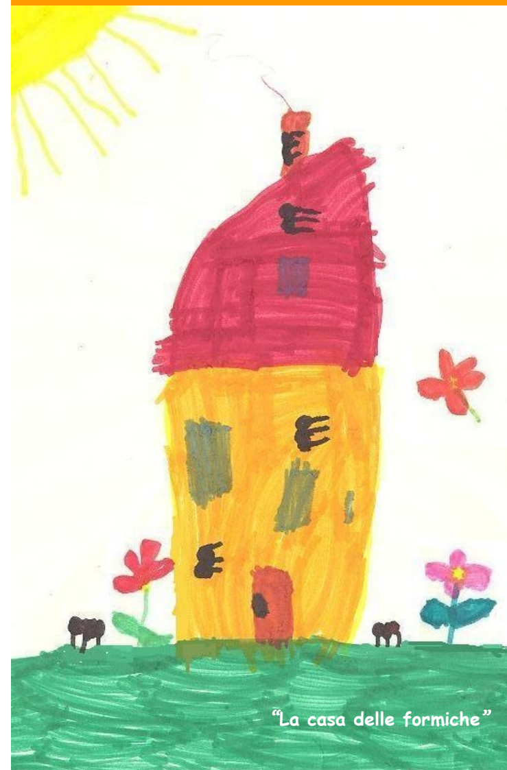
“La casa delle formiche”

di Abbiategrasso, Albairate, Besate, Bubbiano, Calvignasco, Cisliano, Cassinetta di Lugagnano, Gaggiano, Gudo Visconti, Morimondo, Motta Visconti, Ozzero, Rosate, Vermezzo, Zelo Surrigone